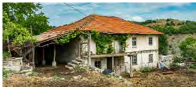
Tekst en Foto's: © Fokko Erhart / www.wildernisfoto.nl

je wilt fotograferen. De blauwtjes spannen de kroon met 30 verschillende soorten gevolgd door dikkopjes, witjes en parelmoervlinders met allen bijna 20 verschillende soorten. Vermeldenswaardige soorten uit deze families zijn respectievelijk het bloemenblauwtje, geelbandspikkeldikkopje, schildzaalwitje